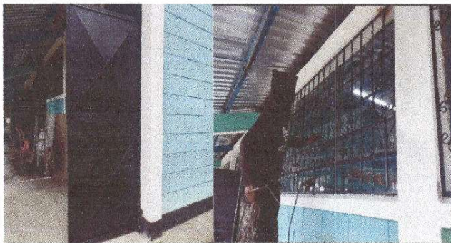
Foto 5: Proceso de mantenimiento a puertas y balcones(lijado, sujecioneas, aplicación de pinturas)