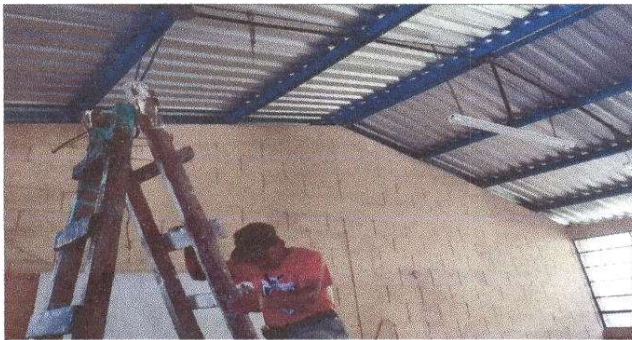
Foto 3: Proceso de reparación de sistema eléctrico: sustitución de lámparas de 2X40; sustitucion de interruptores, reparacion de cableado electrico y sustitucion de ducto electrico +accesorios.