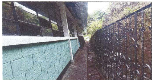
Foto 6: Proceso de sustitucion de vidrios y mantenimiento de balcones de metal.

Observación: Si es necesario se pueden agregar hojas adicionales y actualizar el número de