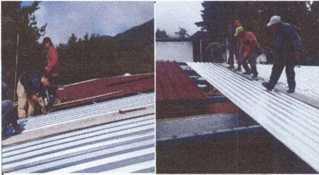
Foto1: Proceso de sustitución de lámina por lámina troquelada Aluzinc, calibre 26. Un total de 653 M2.