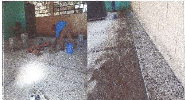
Foto 2: Proceso de stitución de piso por piso granito, un total de 160 m2.